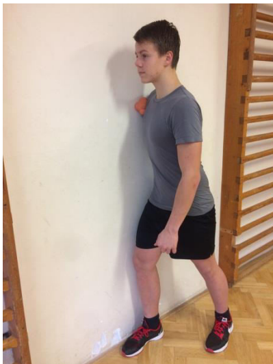
Obr.: Uvolnění prsních svalů.

Malý a velký prsní sval – u nás velký problém. Zkrácení a přetížení v tlakových cvicích vede k častým problémům s ramenním kloubem vlivem špatné stabilizace.