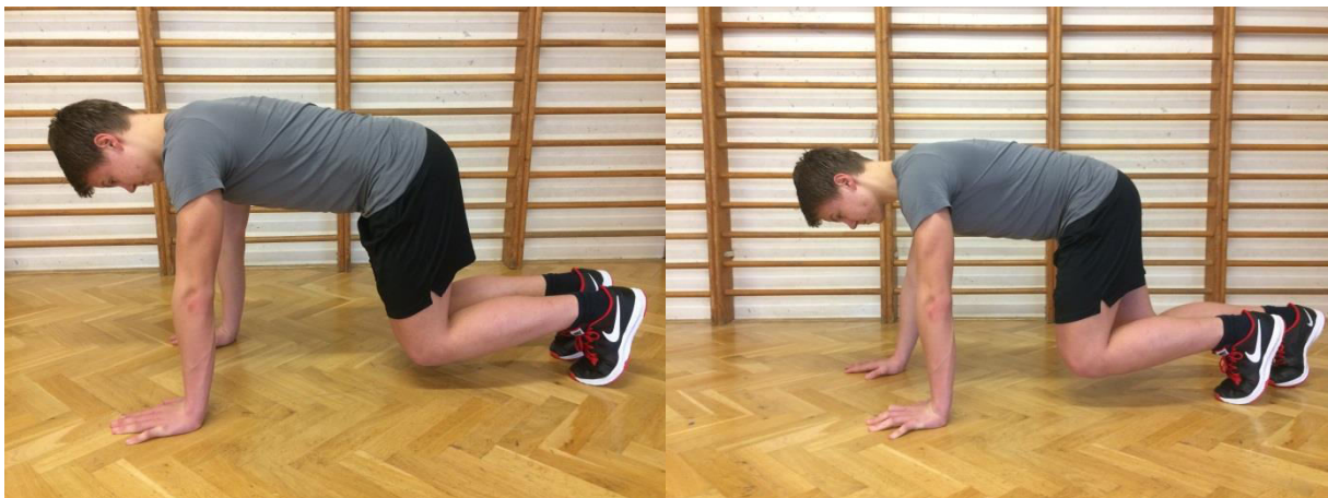
Obr.: „Lezení“ aktivující kontralaterální (zkřížené) pohybové vzory.

Problematika je mnohem širší a přesahuje možnosti tohoto krátkého informativního článku. Pokud ovšem budete mít zájem dozvědět se více o správném nácviku, či budete chtít znát další průpravné cviky, neváhejte mě kontaktovat.