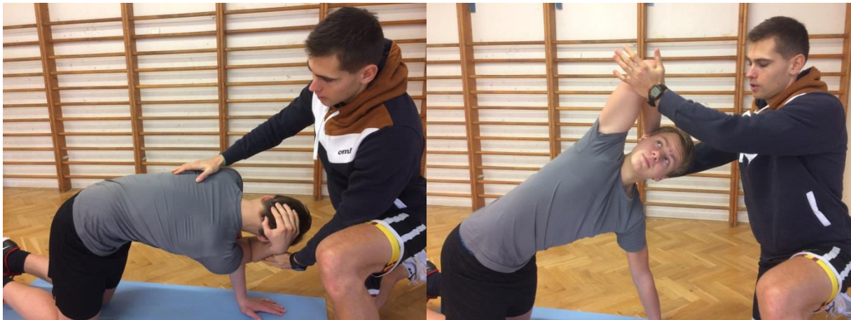
Obr.: Zvýšení mobility v hrudní páteři.