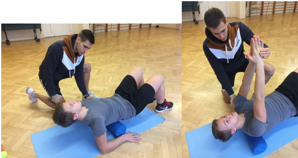
Obr.: Uvolnění bederní a hrudní páteře.

Široký sval zádový – hlavní záběrový sval. Špatná biomechanika pohybu při jeho zkrácení.